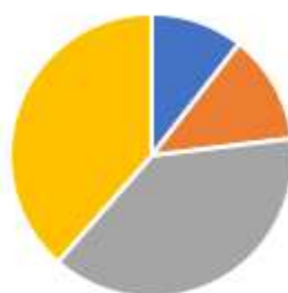
Emprunts en cours